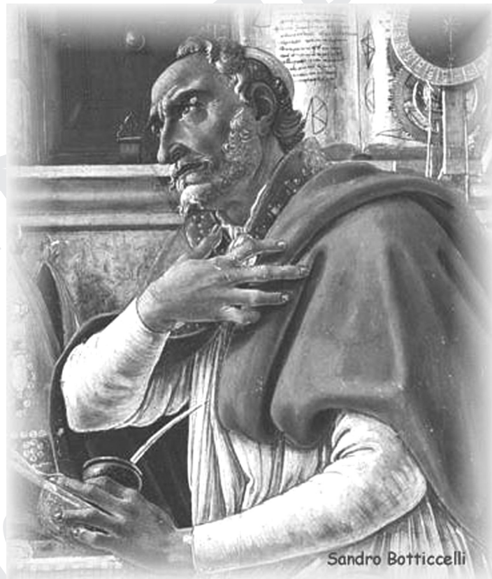
ภาพที่ 5.1 เซนต์ ออกัสติน

อิทธิพลของคริสต์ศาสนาเกิดจากคำสอนของนักปรัชญาคริสต์ศาสนาที่สำคัญ 2 ท่าน คือ เซนต์ ออกัสติน (St. Augustine, ค.ศ. 345-430) และเซนต์ อโควนัส (St. Aquinas, ค.ศ. 1266-1273) เซนต์ ออกัสตินมีผลงานที่สำคัญคือ อาณาจักรหรือนครของพระเจ้า (The City of God) ซึ่งได้อธิบายแนวคิดของศาสนาคริสต์ว่า นครของพระเจ้าเป็นโลกแห่งความบริสุทธิ์ เมื่อวิญญาณมนุษย์ได้พบพระเจ้าแล้วก็จะได้รับความสุข มนุษย์จึงต้องศรัทธาในศาสนาจักร (Church) และในคัมภีร์ไบเบิลโดยไม่ต้องโต้แย้งหรือตั้งคำถามใดๆ และต้องศรัทธาในพระเจ้าอย่างแรงกล้า จึงจะสามารถสัมผัสกับพระเจ้า (จิตวิญญาณ) ได้ ประจวบกับในระยะนั้นจักรพรรดิแห่งจักรวรรดิโรมันกำลังเสื่อมอำนาจลงอย่างมากและได้ตกอยู่ใต้อำนาจของพวกอนารยชนในเวลาต่อมา หลักคำสอนของเซนต์ ออกัสตินจึงมีอิทธิพลเหนือผู้คนในยุคกลางและได้แพร่ขยายอย่างกว้างขวางในยุโรปยุคกลาง