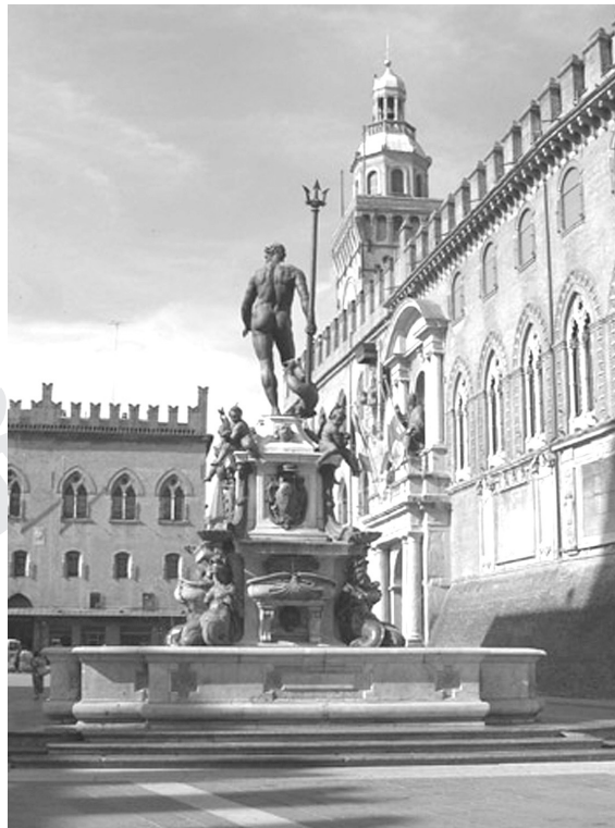
ภาพที่ 5.6 มหาวิทยาลัยโบโลญญา