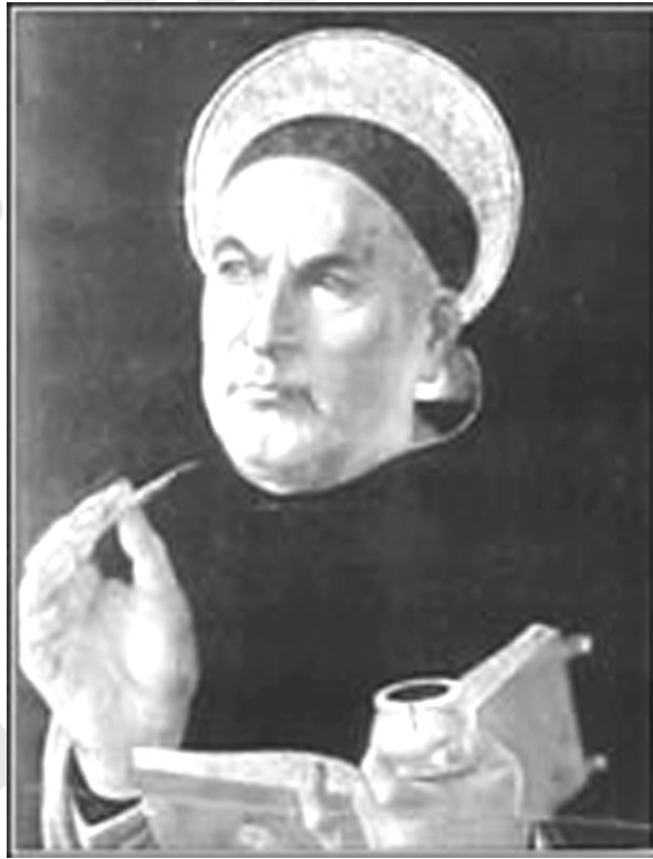
ภาพที่ 5.2 เซนต์ อีโควินัส

สุชัชวีร์รันดร 12 เซนต์ อีโควินัสจึงเป็นนักคิดคนสำคัญของคริสต์ศาสนาในยุคกลางตอนปลายและมีอิทธิพลต่อคริสต์ศาสนิกายโรมันคาทอลิกสืบมาจนถึงปัจจุบัน