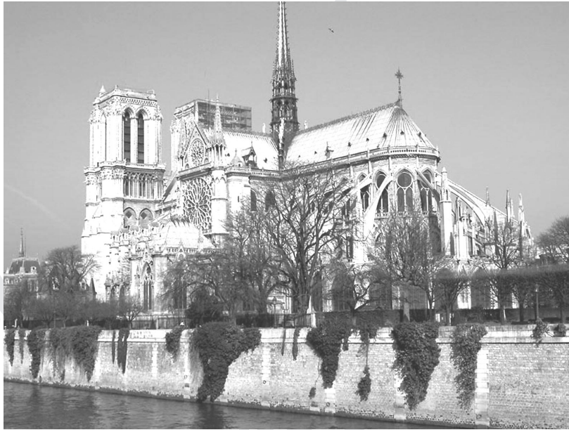
ภาพที่ 5.7 มหาวิหารนอร์ทเทอร์ดาม

กล่าวโดยสรุป ลักษณะเด่นของศิลปกรรมในยุคกลางเป็นงานสร้างสรรค์ที่สร้างขึ้น เพื่อเผยแพร่คำสอนของคริสต์ศาสนาซึ่งมีศาสนจักรเป็นองค์กรสำคัญที่เรียกศรัทธาจากคนทั่วไปในการหาทุนและการก่อสร้าง โดยมีพระเป็นผู้มีบทบาทที่สำคัญในการก่อสร้างวัด โบสถ์หรือวิหาร จึงได้เกิดมีศิลปกรรมต่างๆ ขึ้นมากมายภายในโบสถ์วิหารต่างๆ ซึ่งเป็นการแสดงให้เห็นถึงความแตกต่างระหว่างโลกมนุษย์กับโลกของพระเจ้าอย่างเห็นชัดเจน