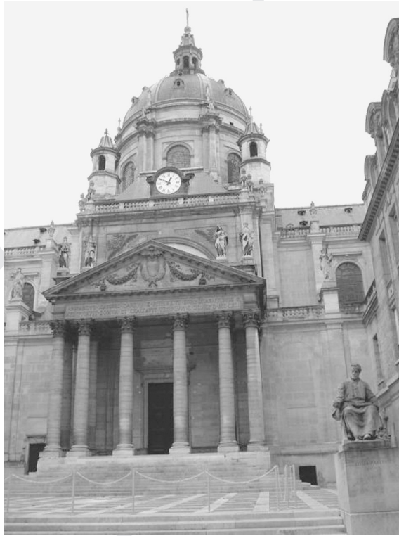
ภาพที่ 5.5 มหาวิทยาลัยปารีส