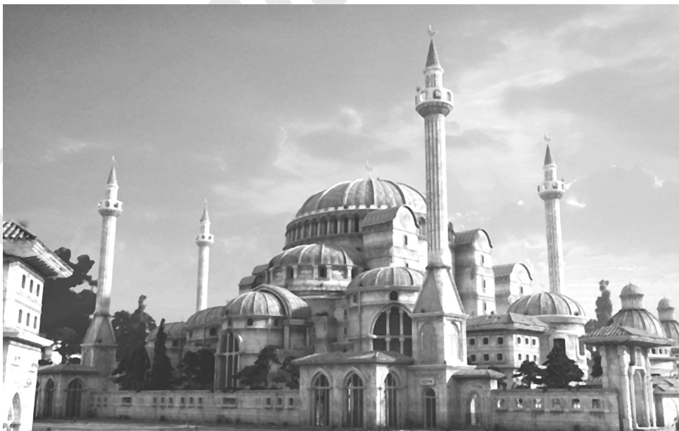
ภาพที่ 5.3 โบสถ์เซนต์ โซเฟีย

ด้านศิลปกรรมการก่อสร้างสมัยจักรพรรดิจัสติเนียนได้มีการสร้างสถาปัตยกรรมวิหารรูปโดม การแกะสลักงานช่างที่งดงามและการออกแบบการออกแบบกระเบื้องโมเสกที่สวยงาม พระองค์ได้โปรดให้สร้างโบสถ์หรือวิหารขนาดใหญ่ในกรุงคอนสแตนติโนเปิลถึง 36 แห่ง วิหารรูปโดมที่มีชื่อเสียงคือ โบสถ์เซนต์ โซเฟีย (ปัจจุบันอยู่ในกรุงอิสตันบูล ประเทศตุรกี) พระองค์ยังได้โปรดให้สร้างโบสถ์ในดินแดนที่ขยายอำนาจออกไปในอียิปต์ ปาเลสไตน์ กรีซ และอิตาลี เช่น โบสถ์เซนต์ มาร์ค (St. Mark) ในเมืองเวนิส ประเทศอิตาลี เป็นต้น นอกจากนี้พระองค์ได้โปรดให้สร้างโรงพยาบาล โรงเรียน สถานที่พักผ่อนหย่อนใจสาธารณะ ถนน และป้อมปราการต่างๆ เหมือนกับกรุงโรมเมื่อครั้งที่ยังมีความเจริญรุ่งเรืองในอดีต